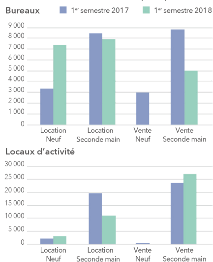
Volumes commercialisés (en m 2 )

La recherche de bureaux et de locaux d'activité toutes surfaces en neuf est soutenue. Mais le manque de produits et le faible renouvellement de l'offre conduisent à un marché atone sur ces deux segments ; au cours du premier semestre 2018, aucune vente n'a été enregistrée.